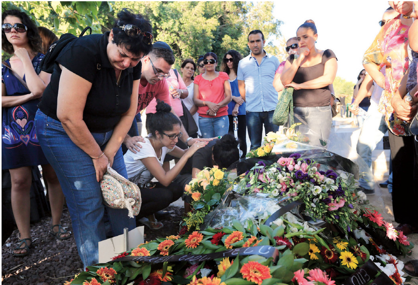
הלווית של מיזל "כששמעתי על האסון בגואטמלה, תהיתי אם הלקחים מהמקרה הקודם לא נלמדו", אומר עורך הדין של משפחתה