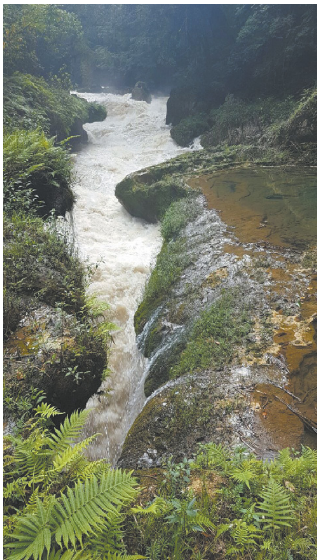
הנהר שבו טבעה שוש