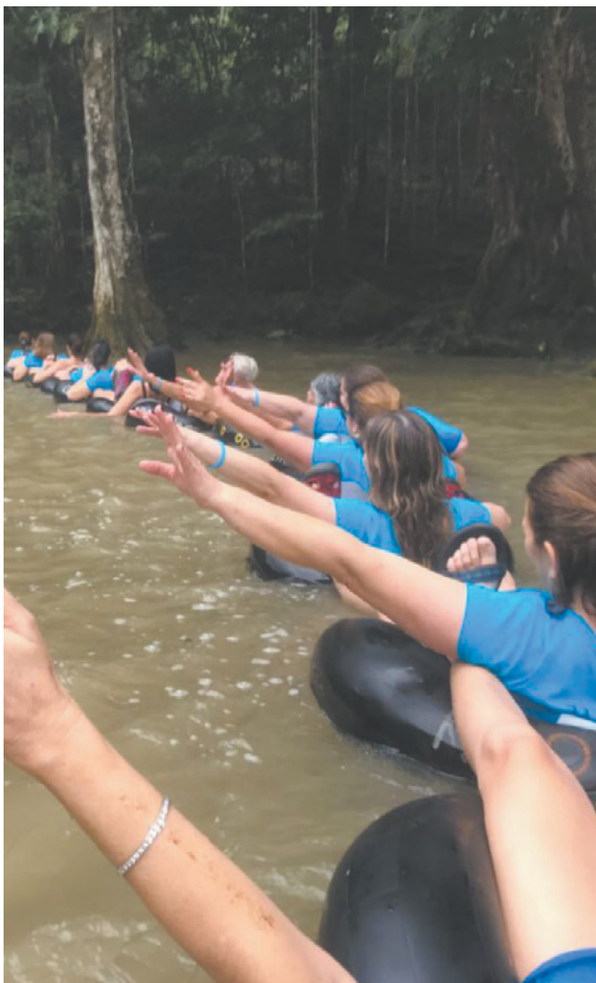
הקבוצה שטה במי הנהר, זמן קצר לפני האסון