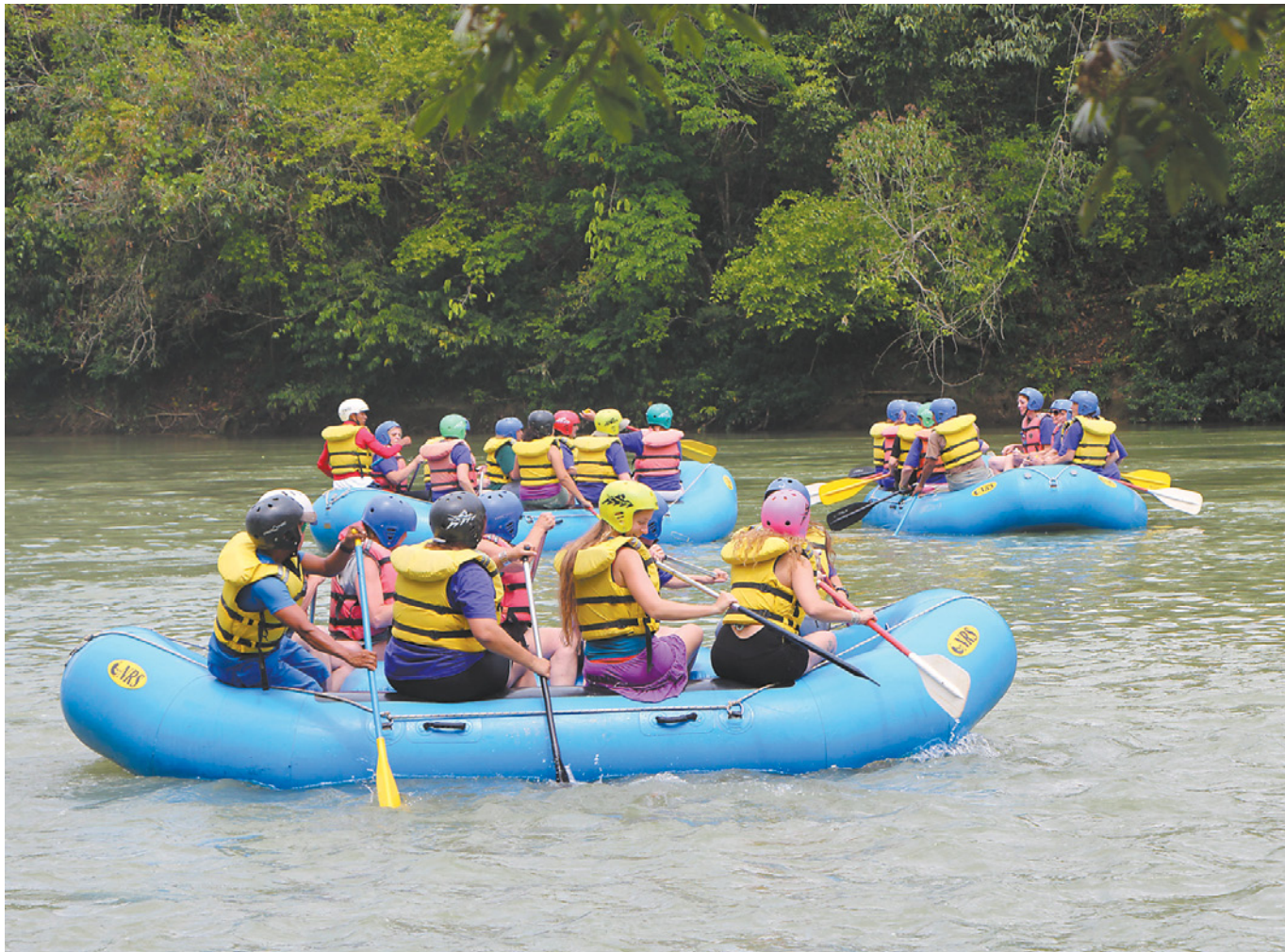
השיט בנהר בגוטמאלה, שבו השתתפה כתבתנו ב־2013, מטעם מלכת המדבר. אז הבנות צוידו באפודי ציפה ובקטדות ועברו תדריך בטיחות

במסגרת עבודתי, סיקרתי פעמיים מסעות של מלכת המדבר. בשני המקרים חוויתי מסע מלא חוויות ואתגרים. השבילים שבהם נהגנו בסין ובגואטמלה היו שבילי כורכר או דרכי עפר, נטולי אלמנטים מסוכנים, ולא דרשו יכולת נהיגה טכנית